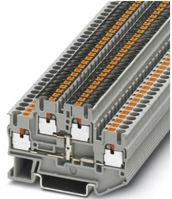
Abbildung zeigt Variante in grau

http://eshop.phoenixcontact.de/phoenix/treeViewClick.do?UID=3000715