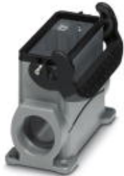
HEAVYCON Sockelgehäuse B 16, mit Längsbügel, Höhe 84mm, mit Stutzen 1x M32

Bitte beachten Sie, dass die hier angegebenen Daten dem Online-Katalog entnommen sind. Die vollständigen Informationen und Daten entnehmen Sie bitte der Anwenderdokumentation. Es gelten die Allgemeinen Nutzungsbedingungen für Internet-Downloads. ( http://download.phoenixcontact.de )