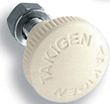
AP-38-2-Ivory (特注色) アイボリー (custom-made color)