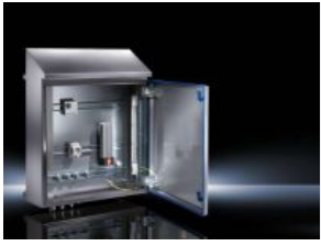
Hygienic Design Kompakt-Schaltschrank HD