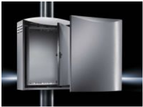
CS Wandgehäuse Gehäuse im Gehäuse