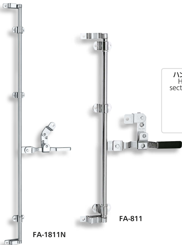
ハンドル断面寸法 Handle cross section dimension