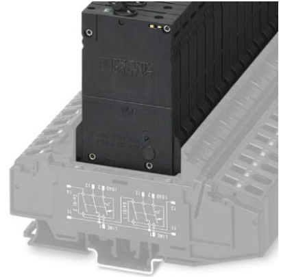
Abbildung zeigt die Variante TMCP 1 F1 300 2,0A

http://eshop.phoenixcontact.de/phoenix/treeViewClick.do?UID=0915849