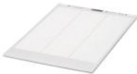
Etikettenbogen DIN-A4, Bogen, weiß, unbeschriftet, beschriftbar mit: Office-Drucksysteme, Montageart: Kleben, Schriftfeldgröße: 12 x 12 mm

Bitte beachten Sie, dass die hier angegebenen Daten dem Online-Katalog entnommen sind. Die vollständigen Informationen und Daten entnehmen Sie bitte der Anwenderdokumentation. Es gelten die Allgemeinen Nutzungsbedingungen für Internet-Downloads. ( http://download.phoenixcontact.de )