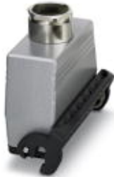
Kupplungsgehäuse, mit Längsbügel, Höhe 79 mm, mit Verschraubung, 1x Pg29

Bitte beachten Sie, dass die hier angegebenen Daten dem Online-Katalog entnommen sind. Die vollständigen Informationen und Daten entnehmen Sie bitte der Anwenderdokumentation. Es gelten die Allgemeinen Nutzungsbedingungen für Internet-Downloads. ( http://download.phoenixcontact.de )