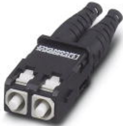
LWL-Steckverbinder SCRJ, IP20, duplex, mit Schnellanschlusstechnik, für Glasfaser Multimode 50/125 µm, für Einzeladerdurchmesser 2,9 mm

Bitte beachten Sie, dass die hier angegebenen Daten dem Online-Katalog entnommen sind. Die vollständigen Informationen und Daten entnehmen Sie bitte der Anwenderdokumentation. Es gelten die Allgemeinen Nutzungsbedingungen für Internet-Downloads. ( http://download.phoenixcontact.de )