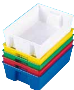
réf. PL-C code 3922 + coloris dim int. L x l x H : 190 x 120 x 50 mm • encastrables et empilables par retournement • rouge, vert, jaune, blanc, bleu