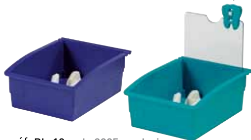
réf. PL-18 code 3925 + coloris dim. int. L x l x H : 126 x 178 x 79 mm • rouge, vert, jaune, blanc, bleu, noir, orange

En polystyrène choc, ces plateaux sont très appréciés par les laboratoires du secteur dentaire et notamment par les prothésistes.