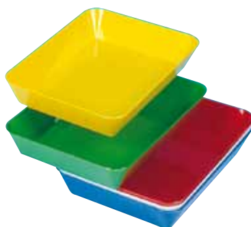
réf. PL-B code 3920x + coloris dim. int. du fond L x l x H : 210 x 150 x 40 mm dim ext. L x l x H : 260 x 196 x 42 mm • encastrables • rouge, vert, jaune, blanc, bleu