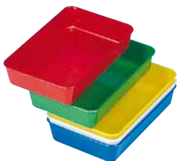
réf. PL-A code 3910x + coloris dim. int. du fond L x l x H : 175 x 100 x 34 mm dim ext. L x l x H : 205 x 130 x 37 mm • encastrables • rouge, vert, jaune, blanc, bleu