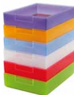
réf. PLATEAUX-PENICHES code 2650x + coloris dim int. L x l x H : 230 x 158 x 48 mm dim ext. L x l x H : 240 x 167 x 52 mm • empilables • rose, vert, orange, blanc, bleu, violet