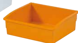
réf. PL-16 code 3924 + coloris dim. int. L x l x H : 208 x 178 x 79 mm • rouge, vert, jaune, blanc, bleu, noir, orange