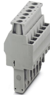
Abbildung zeigt die 6-polige Variante

http://eshop.phoenixcontact.de/phoenix/treeViewClick.do?UID=3045800