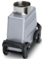
HEAVYCON Kupplungsgehäuse B16, mit Querbügel, Höhe 80, mm, mit Stutzen 1x M32

Bitte beachten Sie, dass die hier angegebenen Daten dem Online-Katalog entnommen sind. Die vollständigen Informationen und Daten entnehmen Sie bitte der Anwenderdokumentation. Es gelten die Allgemeinen Nutzungsbedingungen für Internet-Downloads. ( http://download.phoenixcontact.de )