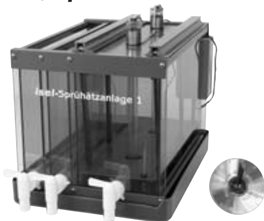
Sprüh-Ätzanlage I (im Vergleich eine CD-Uhr)

... Entwickeln, Spülen und Ätzen mit einem Gerät