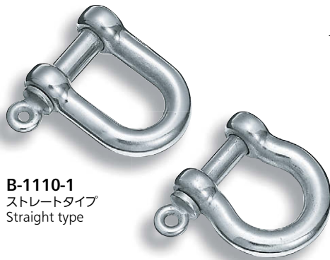
B-1110-1 ストレートタイプ Straight type