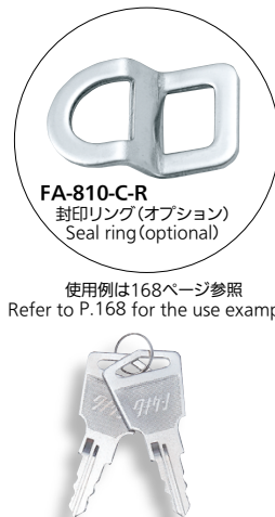
FA-810-C-R 封印リング(オプション) Seal ring (optional)

使用例は168ページ参照 Refer to P.168 for the use example.