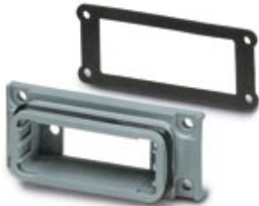
D-SUB-Anbaurahmen, Shell-Größe 2, Schutzart IP67

Bitte beachten Sie, dass die hier angegebenen Daten dem Online-Katalog entnommen sind. Die vollständigen Informationen und Daten entnehmen Sie bitte der Anwenderdokumentation. Es gelten die Allgemeinen Nutzungsbedingungen für Internet-Downloads. ( http://download.phoenixcontact.de )