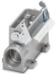
HEAVYCON Sockelgehäuse D 15, mit Längsbügel, Höhe 52 mm, mit Stutzen 1x M25

Bitte beachten Sie, dass die hier angegebenen Daten dem Online-Katalog entnommen sind. Die vollständigen Informationen und Daten entnehmen Sie bitte der Anwenderdokumentation. Es gelten die Allgemeinen Nutzungsbedingungen für Internet-Downloads. ( http://download.phoenixcontact.de )