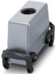
HEAVYCON Tüllegehäuse B24, mit Querbügel, Höhe 76 mm, mit Gewinde 1x M32, Leitungsabgang seitlich

Bitte beachten Sie, dass die hier angegebenen Daten dem Online-Katalog entnommen sind. Die vollständigen Informationen und Daten entnehmen Sie bitte der Anwenderdokumentation. Es gelten die Allgemeinen Nutzungsbedingungen für Internet-Downloads. ( http://download.phoenixcontact.de )