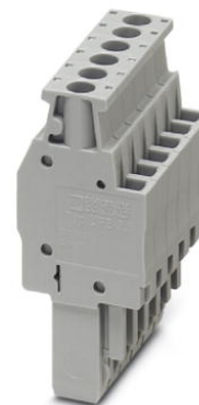
Abbildung zeigt die 6-polige Variante

http://eshop.phoenixcontact.de/phoenix/treeViewClick.do?UID=3045473