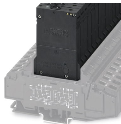
Abbildung zeigt die Variante TMCP 1 F1 300 2,0A

http://eshop.phoenixcontact.de/phoenix/treeViewClick.do?UID=0915632