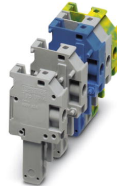
Abbildung zeigt verschiedene Varianten des Produktes (linkes, mittleres und rechtes Element) in verschiedenen Farbstellungen

http://eshop.phoenixcontact.de/phoenix/treeViewClick.do?UID=3060089