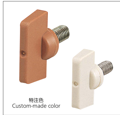
特注色 Custom-made color