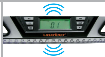
AutoSound bei 0°/45°/90°/135°/180°