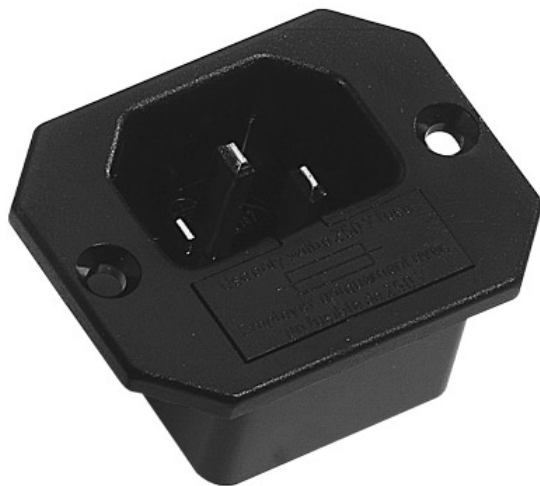
Einbau - Gerätestecker mit Querflansch und Sicherungseinsatz. Alte K+B Serie 711