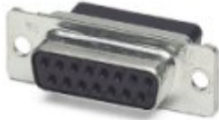
D-SUB-Kontaktträger, Shell-Größe 2, für 15 Signalkontakte, Kontaktart Buchse, für Crimpkontakte, gerade, Befestigung mittels Bohrung 3 mm, für Anbaurahmen und Tüllengehäuse VS-15-...

Bitte beachten Sie, dass die hier angegebenen Daten dem Online-Katalog entnommen sind. Die vollständigen Informationen und Daten entnehmen Sie bitte der Anwenderdokumentation. Es gelten die Allgemeinen Nutzungsbedingungen für Internet-Downloads. ( http://download.phoenixcontact.de )