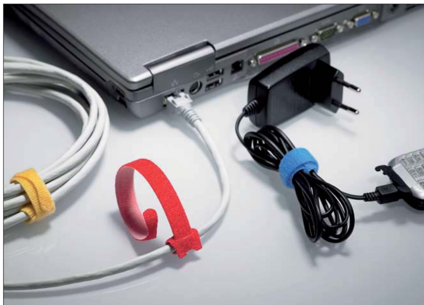
La grande variété de couleurs des TEXTIE permet une identification aisée.

Les TEXTIE représentent une solution efficace pour un maintien souple des câbles, notamment pour les fibres optiques et les câbles de réseau ou de téléphonie. Les TEXTIE sont aussi très utiles pour des installations temporaires, comme lors de salons, manifestations événementielles, ainsi qu'à la maison.