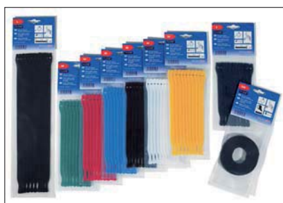
Les colliers TEXTIE sont disponibles en différentes couleurs et tailles.

Embases de fixation disponibles sur demande. Merci de nous contacter !