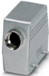
HEAVYCON Tüllegehäuse B16, für Querbügel, Höhe 76 mm, mit Stutzen 1x M32, Leitungsabgang seitlich

Bitte beachten Sie, dass die hier angegebenen Daten dem Online-Katalog entnommen sind. Die vollständigen Informationen und Daten entnehmen Sie bitte der Anwenderdokumentation. Es gelten die Allgemeinen Nutzungsbedingungen für Internet-Downloads. ( http://download.phoenixcontact.de )