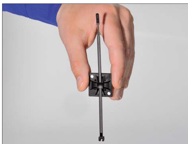
Der Q-mount Montagesockel fixiert den Q-tie Kabelbinder sogar in vertikaler Position - das vereinfacht die Montage!