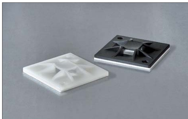
Q-mount 4-Wege-Montagesockel QM schraubbar und QM(A) selbstklebend.