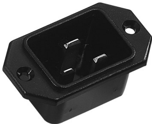
Einbau - Gerätestecker, 16A mit Längsflansch. Alte K+B Serie 751