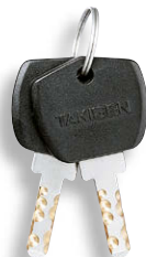
鍵違い Key differences