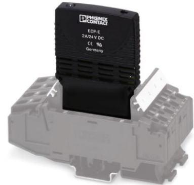
Abbildung zeigt eine Variante des Artikels

http://eshop.phoenixcontact.de/phoenix/treeViewClick.do?UID=0900126