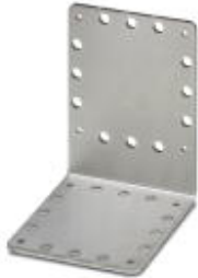
DUPLICON, Montagewinkel, bestehend aus 3 mm Edelstahlblech, mit vorgebohrten Löchern

Bitte beachten Sie, dass die hier angegebenen Daten dem Online-Katalog entnommen sind. Die vollständigen Informationen und Daten entnehmen Sie bitte der Anwenderdokumentation. Es gelten die Allgemeinen Nutzungsbedingungen für Internet-Downloads. ( http://download.phoenixcontact.de )