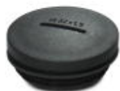
Blindstopfen, aus Kunststoff, Größe: M25