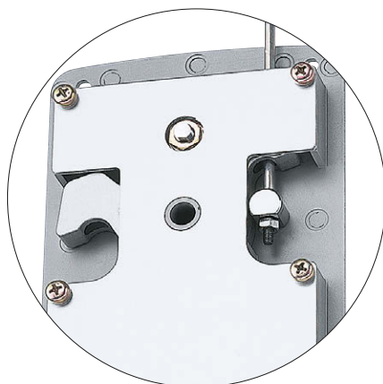
A-898 裏面 (Rear)