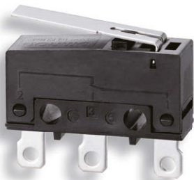
S-3用 For S-3